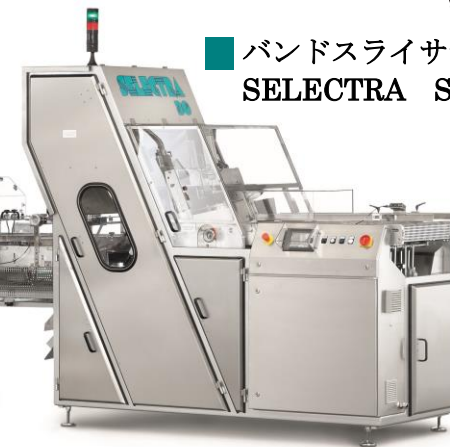
写真:GBK220 + SL30 コンビネーションの一例